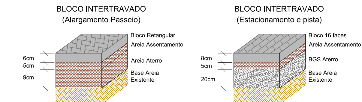
CORTES E CAMADAS PAVIMENTAÇÃO SEM ESCALA